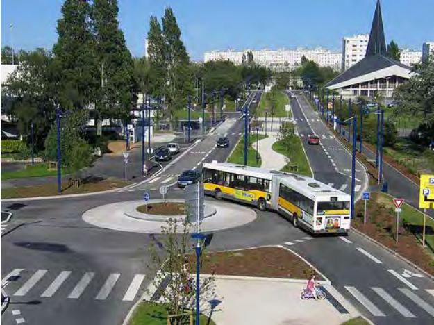
Figure 2 Un carrefour giratoire multi-modal

À Brest, en France, un carrefour giratoire conçu pour tous les modes de circulation sur les voies publiques : transport actif, transport collectif, transport motorisé individuel. D'autres types de giratoires existent. Nous présentons en annexe quelques variations.