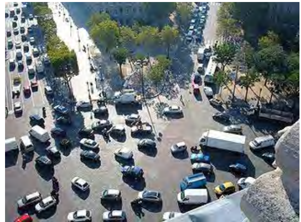
Figure 1 Le rond-point de l'Arc-de-Triomphe, à Paris

Les deux dispositifs partagent en effet des caractéristiques communes, dont une forme circulaire avec entrées et sorties multiples et un îlot central. Cet îlot est parfois accessible aux piétons dans le cas des ronds-points. De manière générale, ces deux dispositifs se caractérisent aussi par l'absence de panneaux d'arrêt ou de feux de circulation 1 .