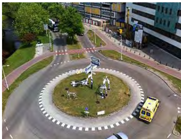
Figure 5 Une piste cyclable en marge de la chaussée d'un giratoire

Celle-ci est généralement située à une ou deux longueurs de voitures en retrait de l'endroit où les voies d'accès croisent les voies circulaires. Le piéton emprunte la même voie.